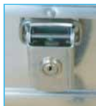
シリンダー(カギ付き)

※当社のZARGESケースには全てこのシリンダー錠付きのパッチ錠が標準で装着されています。(カギは2本付)