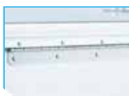
ステンレス製のオリジナルヒンジ