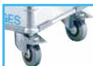
自由型 ( 回転式 )

品名 / AFEK40741 固定式 仕様 / 2 個セット ( ストップパ一付 )