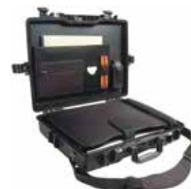
標準装備 ブロックウレタン、ダブルラッチ、3折ダイヤル錠、トレーアクセサリポーチ ショルダーストラップ、パッド付PCスリーブ、17inノートPC(A3)収納可

品番 0512-034 品名 #1490CC ペリカンケース 重量 2.48kg 外寸 504×353×118 内寸 450×288×104 (38/66) 価格 ¥69800+消費税