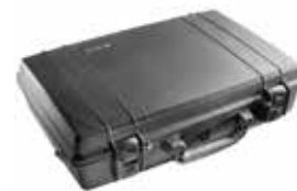
標準装備 ブロックウレタン、ダブルラッチ、シリンダー錠×2

品番 0512-008 品名 #1470 ペリカンケース 重量 1.94kg 外寸 423×331×110 内寸 396×264×95 (35/60) 価格 ¥40900+消費税