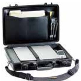
標準装備 ブロックウレタン、ダブルラッチ、シリンダー錠×2 PCトレイ、小物入れ(蓋側)、ショルダーベルト

品番 0512-009 品名 #1490 ペリカンケース 重量 2.48kg 外寸 504×353×118 内寸 450×288×104 (38/66) 価格 ¥48800+消費税