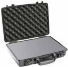
標準装備 ブロックウレタン、ダブルラッチ、シリンダー錠×2

品番 0512-161 品名 #1095 ペリカンケース 重量 1.58kg 外寸 436×336×66 内寸 401×283×52 (26/26) 価格 ¥29000+消費税