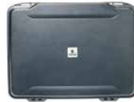
標準装備 ブロックウレタン390×273×20(13mm四方の切れ目)、ショルダーベルト

品番 0512-160 品名 #1085 ペリカンケース 重量 1.41kg 外寸 397×315×63 内寸 363×263×50 (25/25) 価格 ¥22600+消費税