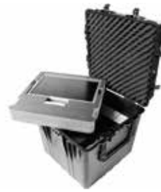
標準装備 ブロックウレタン、ラッチ

品番 0512-014 品名 #0350 ペリカンケース 重量 14.5kg 外寸 571×569×540 内寸 508×508×508 (127/381) 価格 ¥108500+消費税