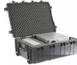
標準装備 ブロックウレタン、ラッチ、キャスター

品番 0512-154 品名 #0500 ペリカンケース 重量 26.58kg 外寸 1014×595×727 内寸 887×468×641 (57/584) 価格 ¥222300+消費税