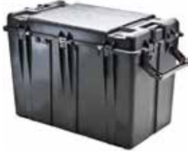
標準装備 ブロックウレタン、ラッチ

品番 0512-015 品名 #0370 ペリカンケース 重量 18.6kg 外寸 673×673×641 内寸 609×609×609 (127/482) 価格 ¥130700+消費税