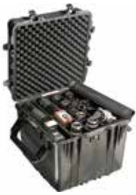
標準装備 ブロックウレタン、ラッチ

品番 0512-014 品名 #0350 ペリカンケース 重量 14.5kg 外寸 571×569×540 内寸 508×508×508 (127/381) 価格 ¥108500+消費税