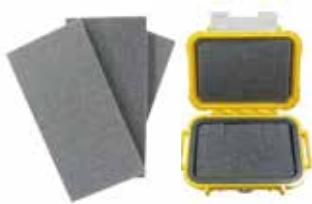
MICRO CASE 内装材 ブロックウレタン