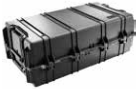
標準装備 ブロックウレタン、ラッチ、キャスター

品番 0512-144 品名 #1730 ペリカンケース 重量 13.6kg 外寸 952×689×365 内寸 863×609×317 (63/254) 価格 ¥142200+消費税