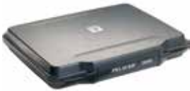
標準装備 ブロックウレタン351×247×20(13mm四方の切れ目)、ショルダーベルト

品番 0512-160 品名 #1085 ペリカンケース 重量 1.41kg 外寸 397×315×63 内寸 363×263×50 (25/25) 価格 ¥22600+消費税